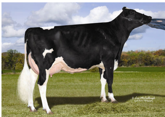
COOKIECUTTER MOM HALO FOURTH DAM