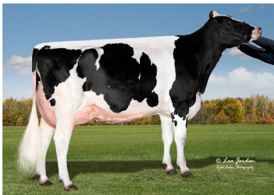
COOKIECUTTER HOPELYNN DAM